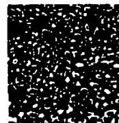
従来例 (A-3 930℃)